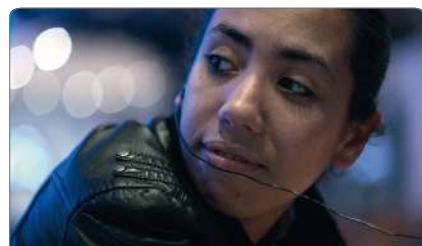
Sur la planche de Leïla Kilani, 2011