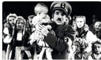
Le dictateur de Charlie Chaplin, 1939