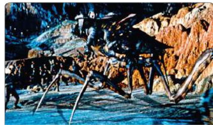
Starship Troopers de Paul Verhoeven, 1997