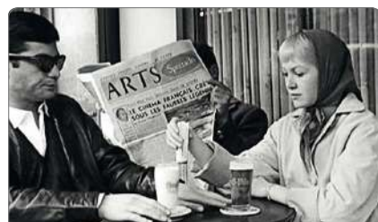
Tous les garçons s'appellent Patrick de Jean-Luc Godard, 1958