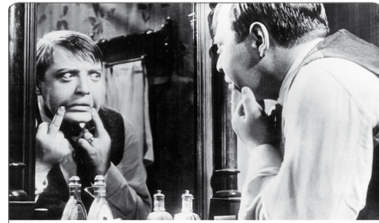
M le maudit de Fritz Lang, 1931