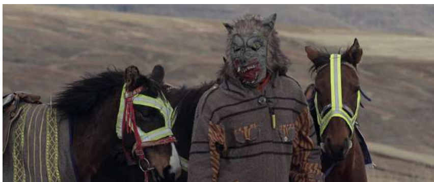
Le Temps du cannibalisme (2020)