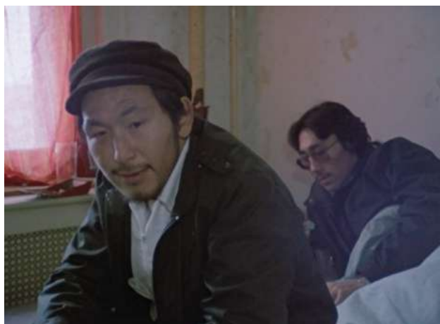
No Address (1988)