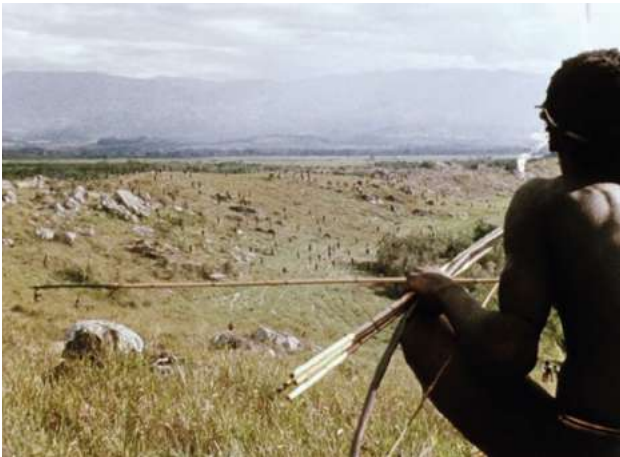
Dead Birds (1964)