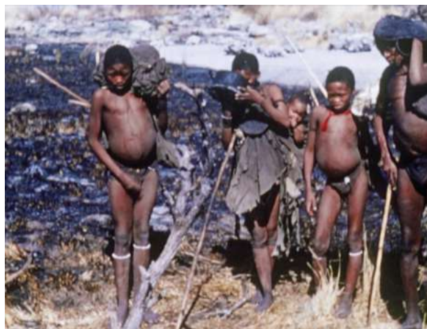
The Hunters (1957)

Dans la seconde moitié du XX e siècle, certains cinéastes commencent à envisager autrement la réalisation de films à teneur ethnographique, à imaginer d'autres méthodes pour aborder des cultures étrangères à la leur. L'une est