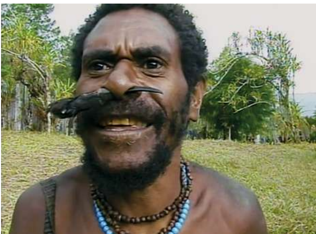
Eux et moi (2001)

d'aucun espace pour exercer une distance critique par rapport à ce qu'il voit: une interprétation lui en est donnée d'emblée. Les protagonistes sont représentés comme des figures mythiques, et si l'on entre en lien avec eux, c'est grâce à la sensibilité visuelle de Gardner, qui donne aux corps et aux éléments une présence vibrante. Par la suite, il tourne en Éthiopie, au Niger, au Bangladesh ou encore en Colombie. Avec son chef-d'œuvre Forest of Bliss (1986), il s'éloigne définitivement de tout didactisme: l'aspect spirituel des rites funéraires de Bénarès y est abordé sous un angle purement sensoriel.