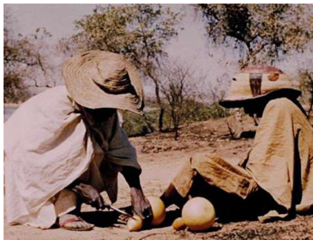
Jaguar (1954)