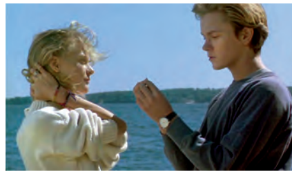
À bout de course de Sidney Lumet (1988)

Camille redouble s'appuie sur des clichés assumés du teen movie : des lieux (qui parfois diffèrent en Amérique et en France pour des raisons culturelles : casiers du lycée