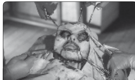
Les yeux sans visage de Georges Franju, 1960

* Les genres cinématographiques : codes et renouvellement notamment autour de Bonnie & Clyde , L'impossible Monsieur Bébé , Les yeux sans visage , Sparrow