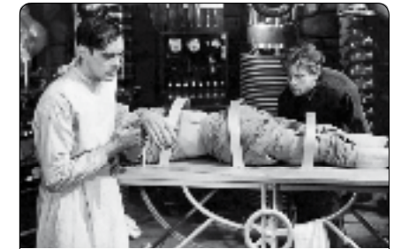
Frankenstein de James Whale, 1931

* De Frankenstein aux Yeux sans visage , « les enfants de Prométhée »