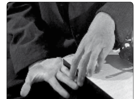
Pickpocket de Robert Bresson, 1959

* Le cinéma de Hong-Kong : des films aux confluences des influences CETTE INTERVENTION POURRA ÊTRE PROPOSÉE EN AMONT DE LA PROJECTION