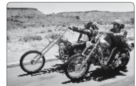
Easy Rider de Dennis Hopper, 1969