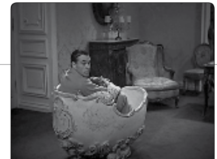
La huitième femme de Barbe bleue d'Ernst Lubitsch, 1938

* L'impossible Mr Hawks : un auteur dans le système hollywoodien