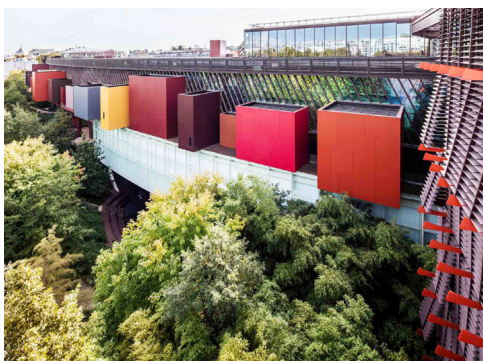
Musée du Quai Branly Jacques Chirac