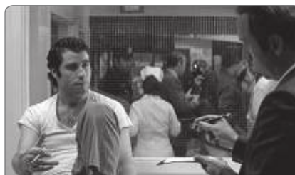
Blow out de Brian De Palma, 1981