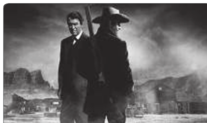
L’homme qui tua Liberty Valance de John Ford, 1962