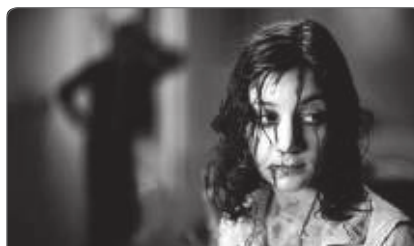
Morse de Tomas Alfredson, 2008