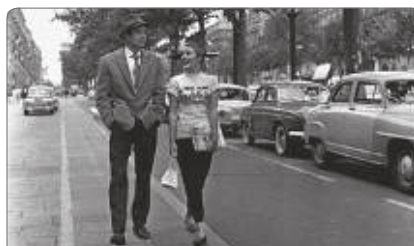
À bout de souffle de Jean-Luc Godard, 1960