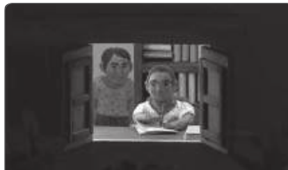
L’image manquante de Rithy Panh, 2013