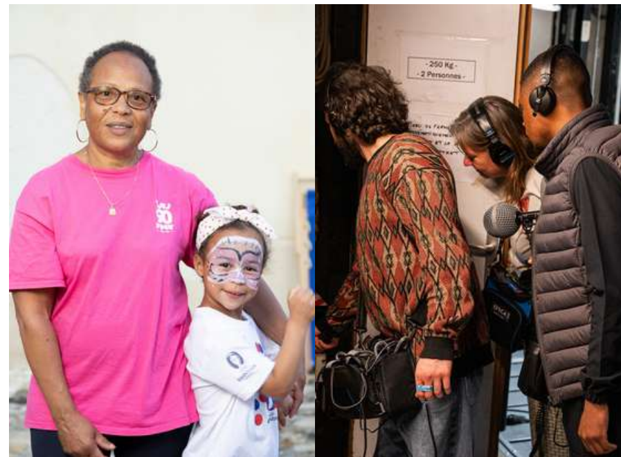
© Sophie Loubaton et Élise Picon